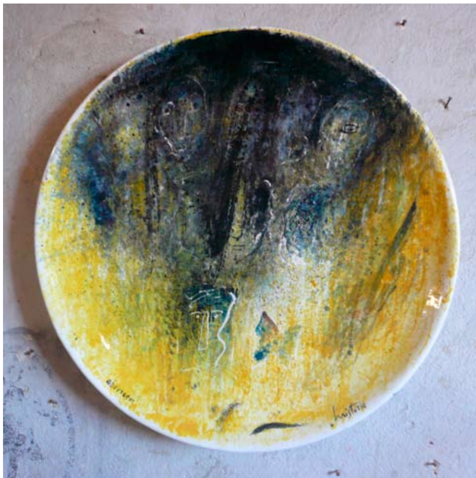
Luiso Sturla Aborigeni , 2010, ø cm 69