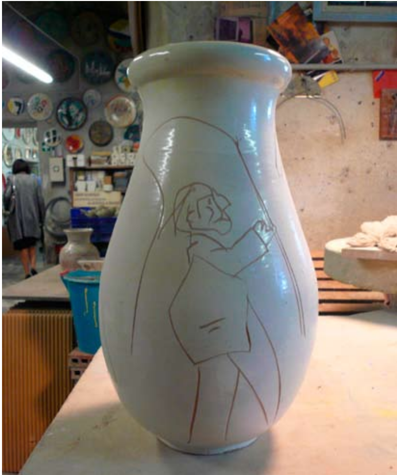
Emilio Tadini Senza titolo , 1990, cm 37 x 22