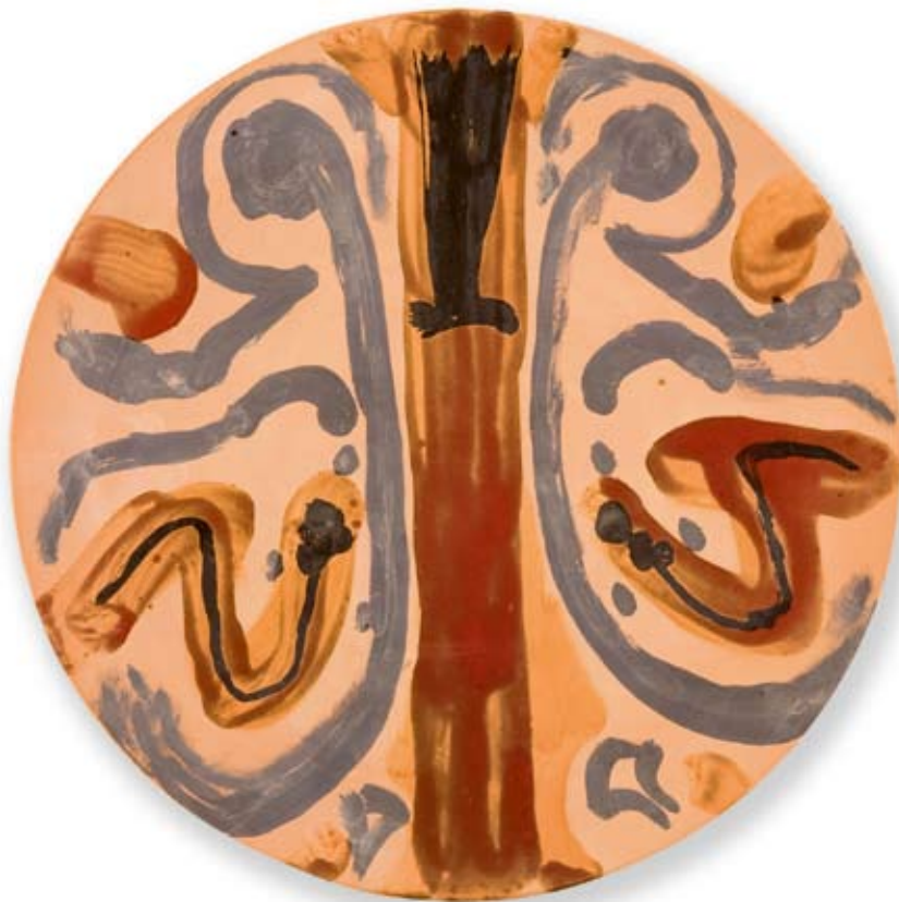
Arturo Carmassi Senza titolo , 1973, \phi cm 51