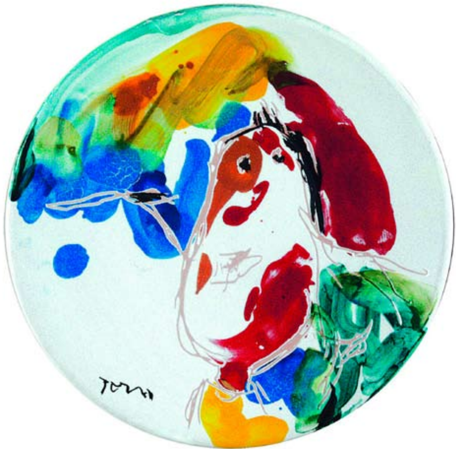
Asger Jorn Senza titolo , 1972, \phi cm 30