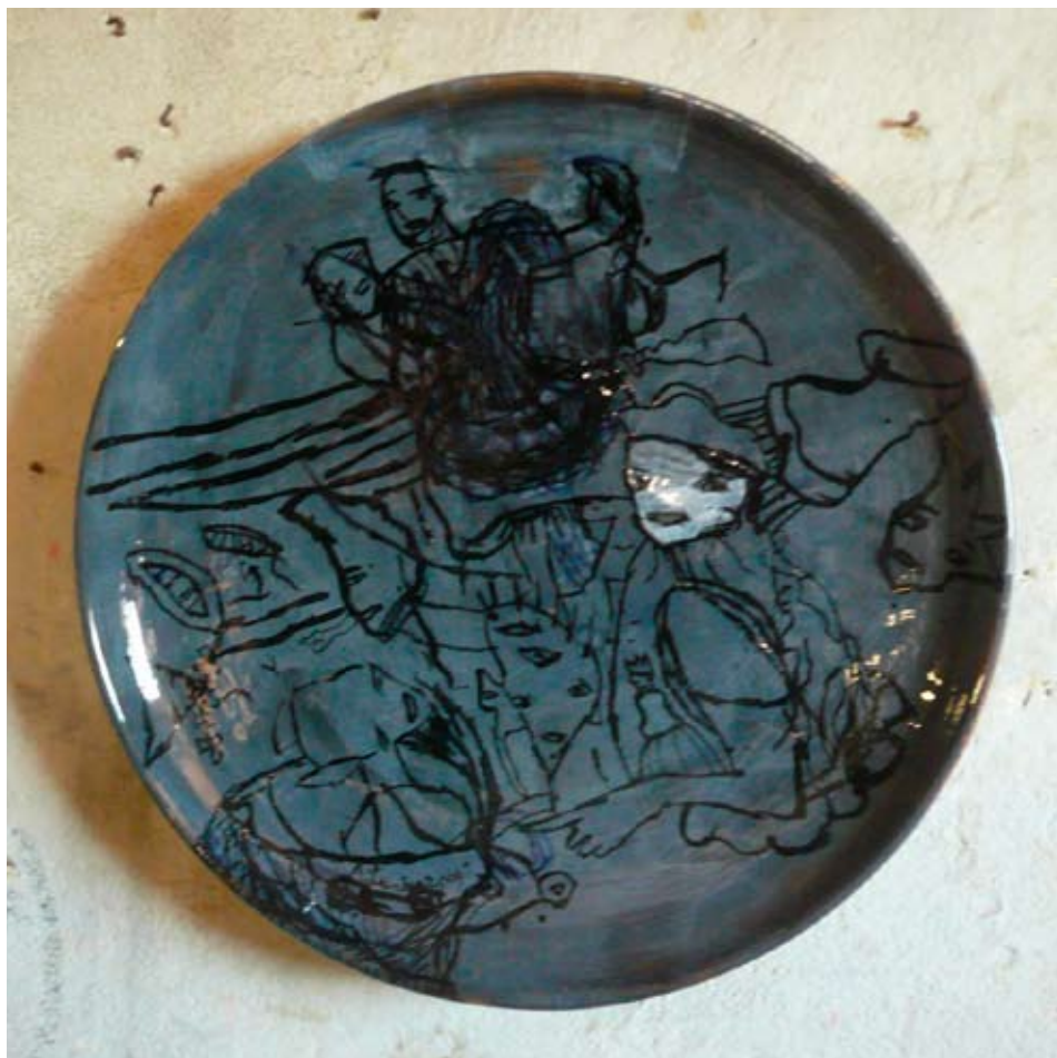
Annette Lucks Senza titolo , 2009, \phi cm 54