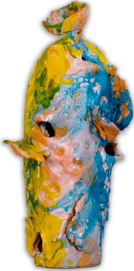
Nes Lerpa Guerriero , 2009, cm 48 x 23