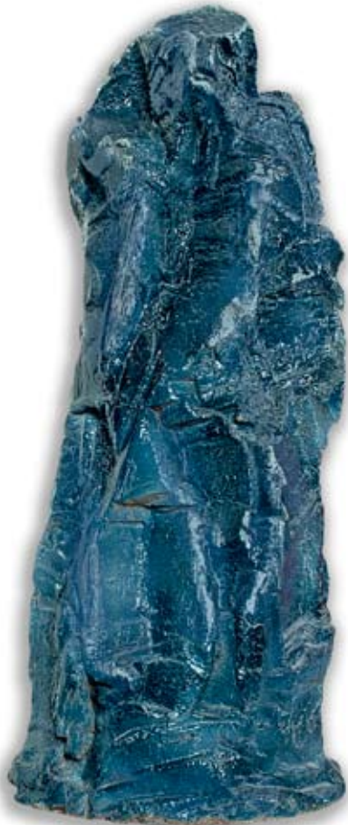
Sandro Cherchi Figura azzurra , 1992, cm 90 x 38