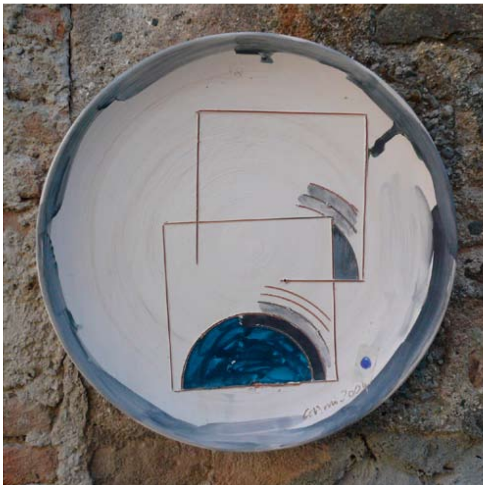
Eugenio Carmi Senza titolo , 2004, \phi cm 40