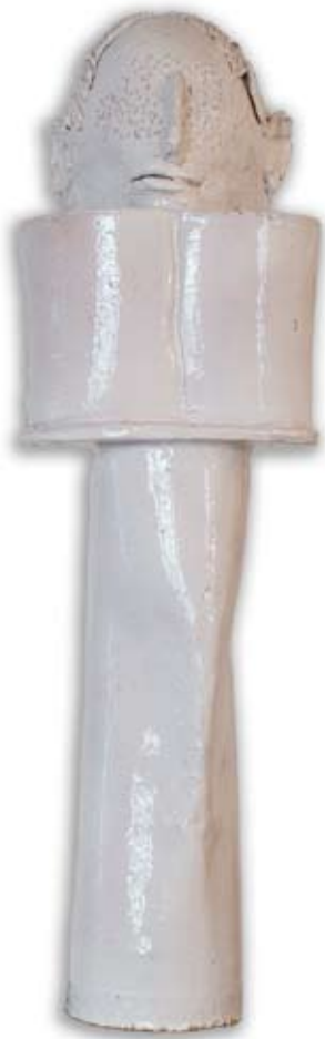
Gaston Orellana Senza titolo , 2009, cm 72 x 22