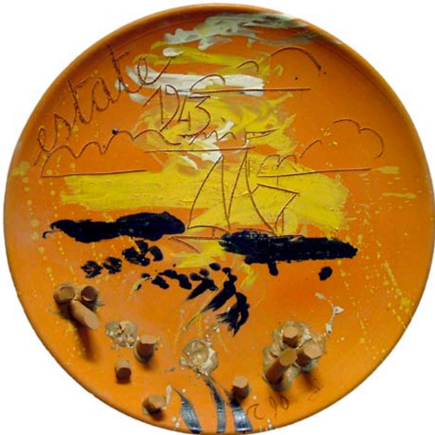
Antonio Recalcati Estate 1943, 1990, ø cm 50