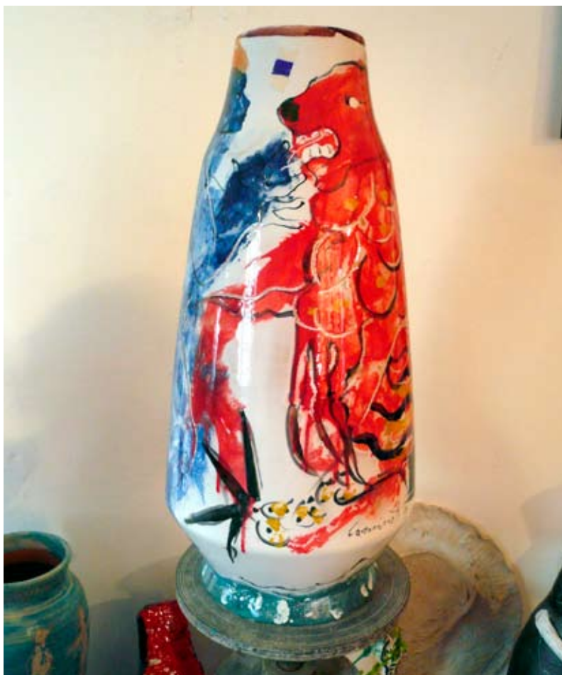
Aurelio Caminati Senza titolo , 1977, cm 70 x 30