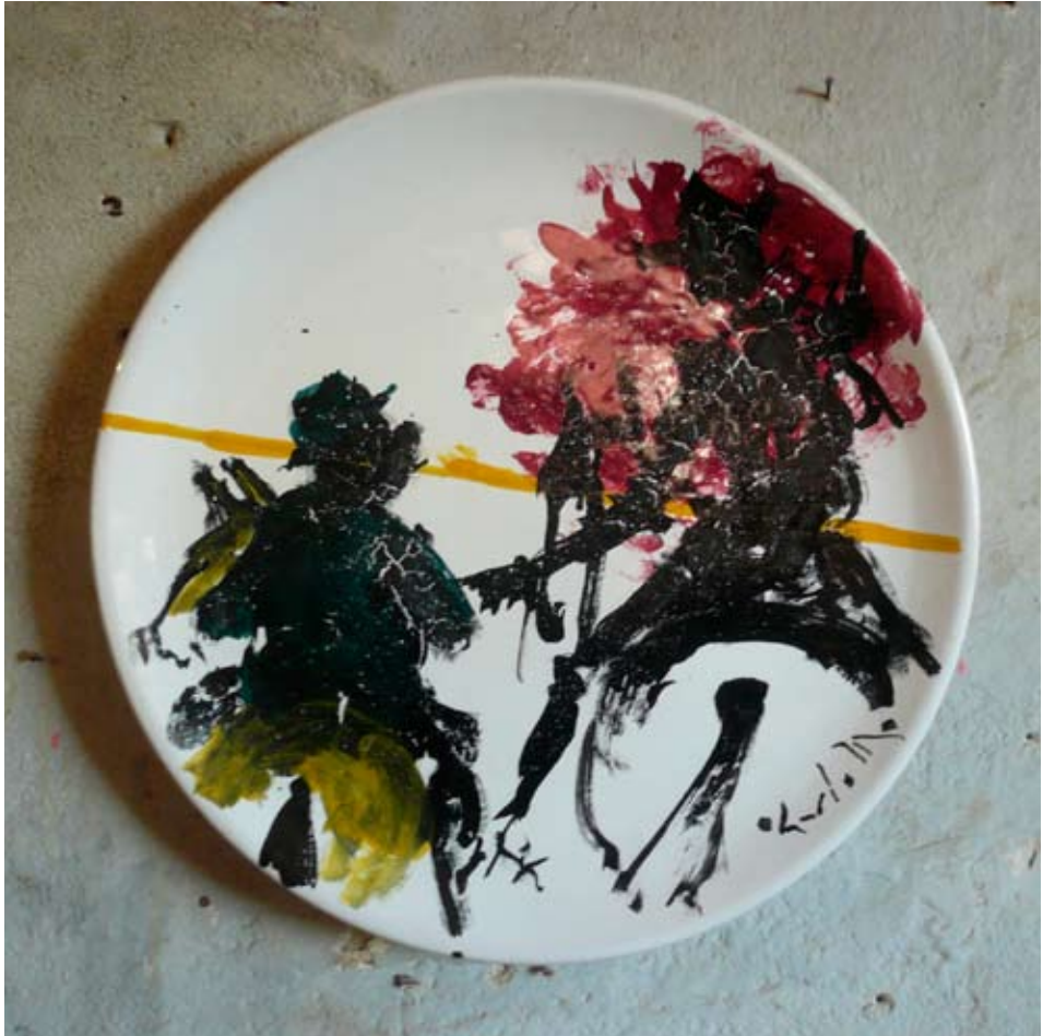
Carlo Mo Battaglia , 2000, ø cm 50