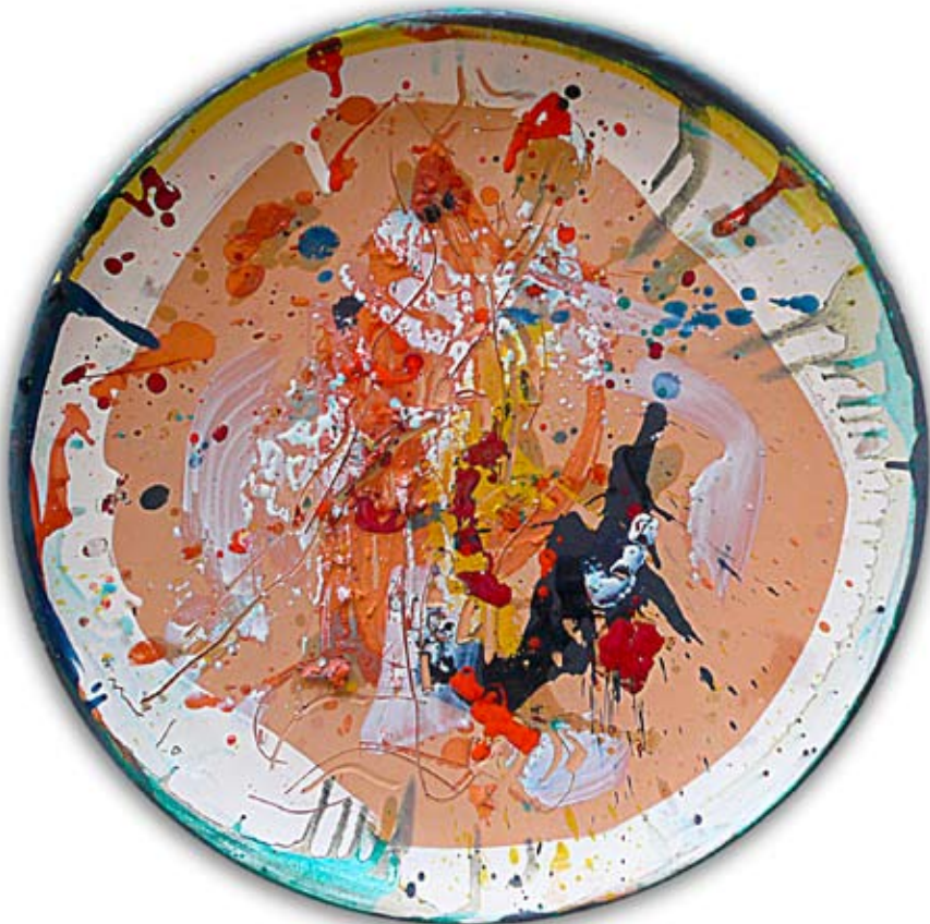
Giorgio Moiso Senza titolo , 2009, \phi cm 59