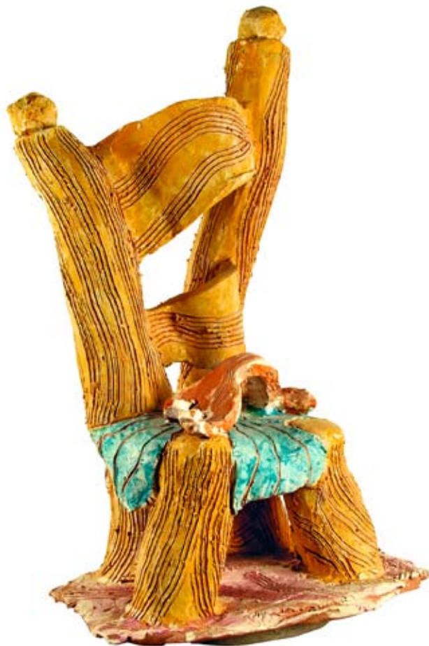
Pietro Bulloni Sedia , 2004, cm 70 x 31 x 40