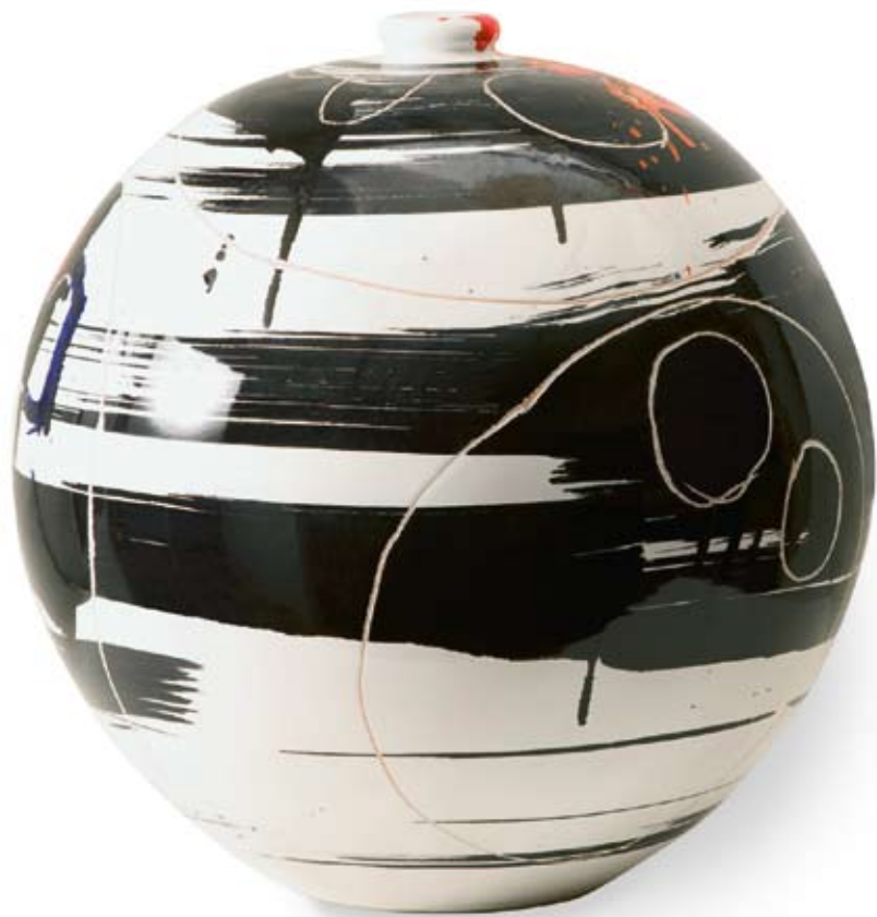
Giancarlo Bargoni Senza titolo , 2006, cm 54