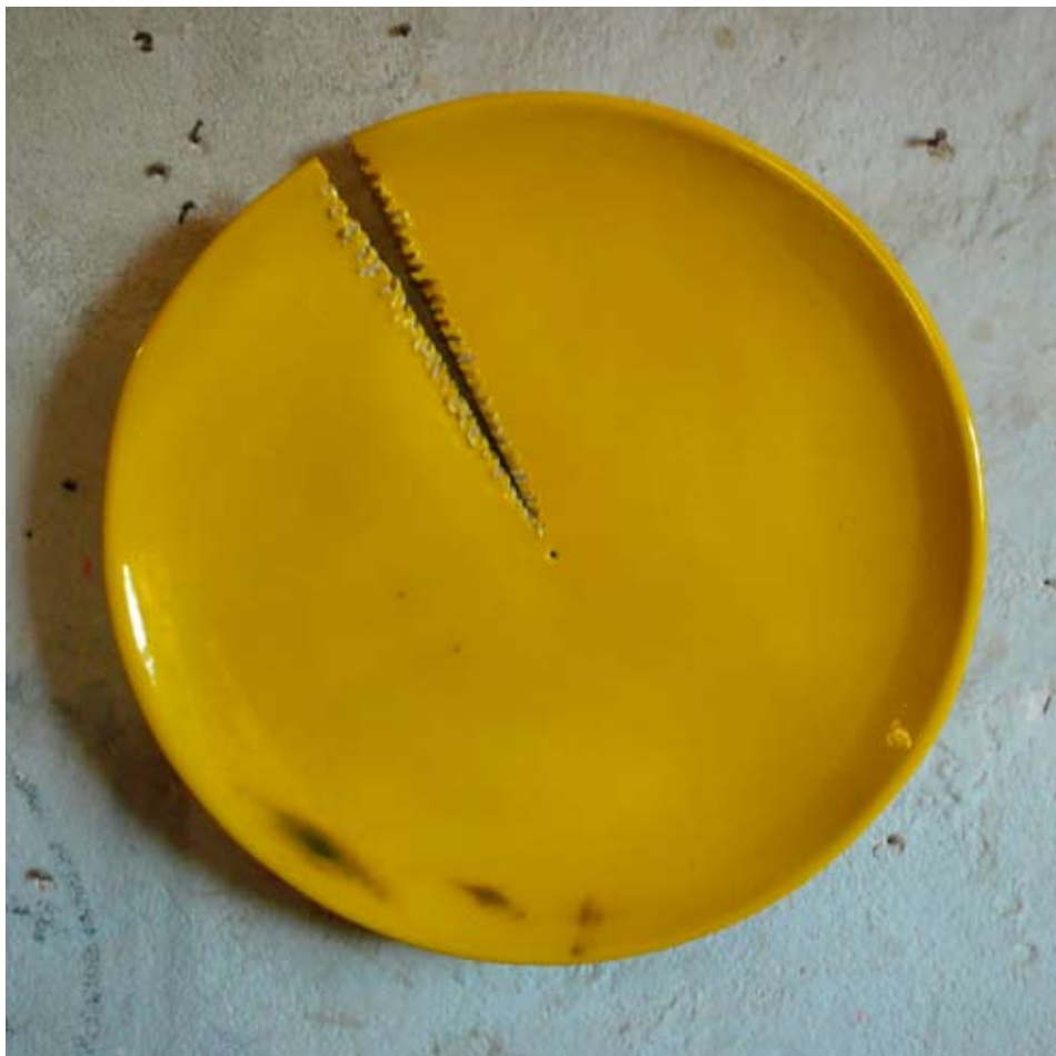
Stefano Soddu Senza titolo , 2008, \varnothing cm 51