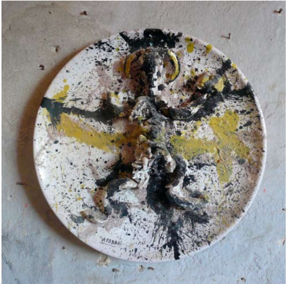
Agenore Fabbri Ballerina , 1980, ø cm 50